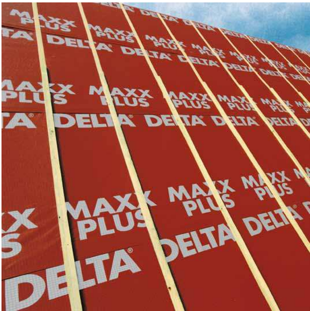
Энергосберегающая мембрана DELTA®-MAXX PLUS для самых качественных крыш.