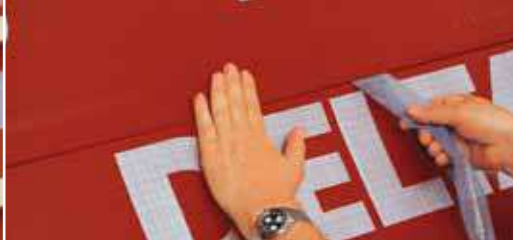
Интегрированная клеящая лента