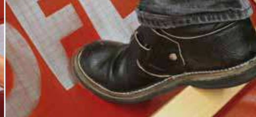
Рекордная прочность и безопасность