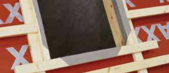
Устройство проёма мансардного окна